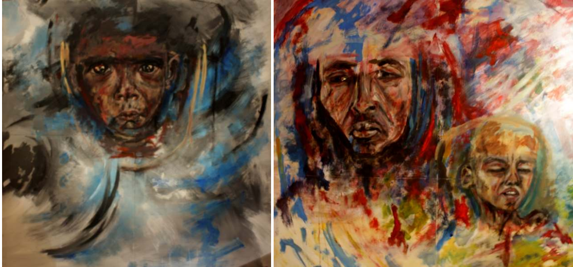
Estas dos obras de 160 x 160 cm ya terminadas formarán parte de la Colección "Rojo sobre Humano".

La estructura de las obras principales está formada por cuatro unidades de 80 x 80 cm de madera DM de 1 cm de grosor, ensamblados por la parte interna. La idea de formar una obra a través de cuatro elementos surge como expresión global de los sentimientos humanos que se unifican en todo el mundo y en todos los continentes sin importar la raza, la religión o la cultura.