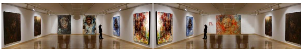
Sala de exposiciones con los cuadros y la animación digital al fondo.

Este proyecto se basa en la creación de 12 obras principales de 160 x 160 cm, diferenciadas por la expresión humana, y la fusión de sus imágenes digitalizadas sobre una obra pictórica de 160 x 160 denominada “Renacimiento” colocada al fondo de la sala de exposiciones a través de un proyector multimedia.