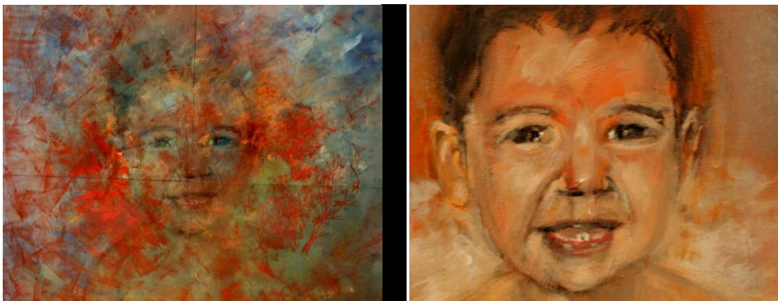
Fusión de imágenes.

La proyección del cuadro "Niño ángel" es un ejemplo real que ya se ha realizado, y que aunque aquí se muestren las imágenes de la fusión, solo se puede observar este efecto a través de la proyección dinámica que adjunto al proyecto y que da idea de la obra.